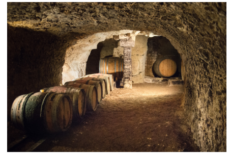
貯蔵トンネルの「トログロディット」